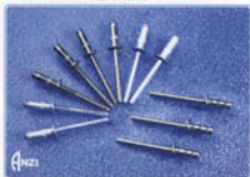
单鼓铆钉 双鼓铆钉